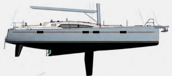
DÉRIVEUR INTÉGRAL CENTREBOARD