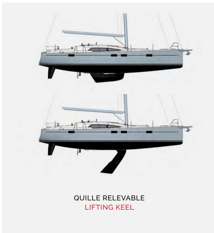
QUILLE RELEVABLE LIFTING KEEL

On the Allures 45.9/S, it is the lifting keel, with a slightly bulbous shape, that carries the ballast with a lower center of gravity. The boat gains nearly 2 tons compared to the full dinghy version. The carbon mast and rod rigging further lighten the overall package, making the boat even faster and more enjoyable at sea. And the limited draft with the keel raised still allows access to remote anchorages!